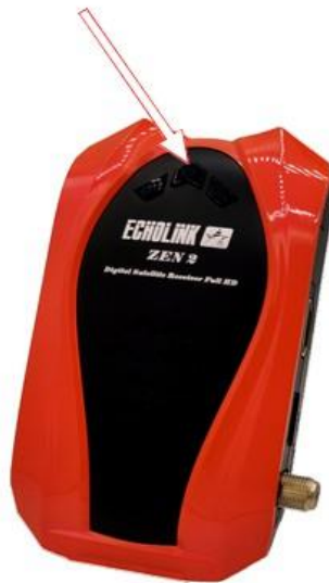
Bouton 'Marche/Arrêt' du récepteur